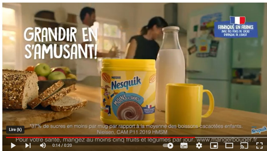
NESQUIK® Grandir en s'amusant ! TV spot 2021