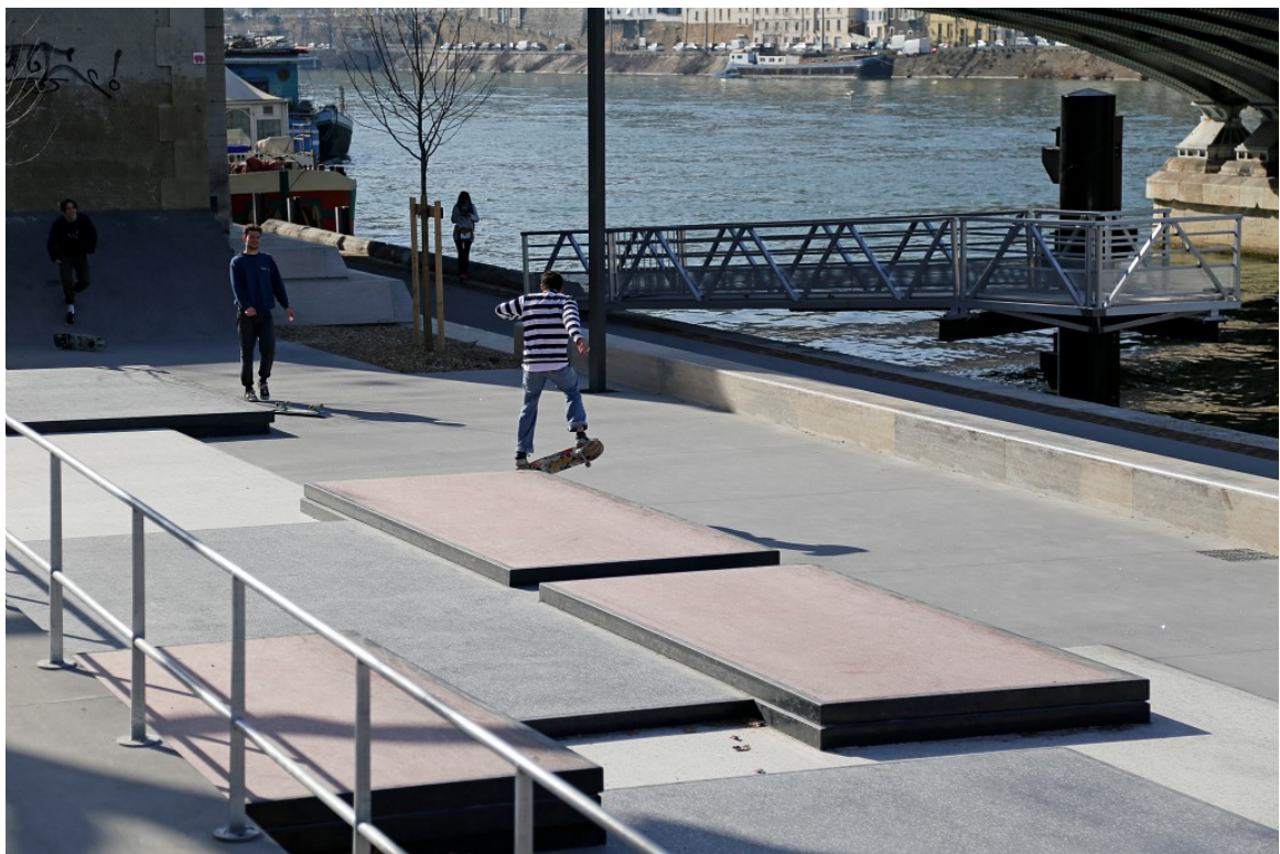
Le skate parc des Rives de Saône et le passage sous les ponts - février 2019

Le quai bas a été abaissé pour retrouver son niveau historique. Il accueille un espace partagé dédié au skate et est relié au quai haut par une rampe d'accessibilité. Le quai haut, sous le pont de l'autoroute, a également été réaménagé.