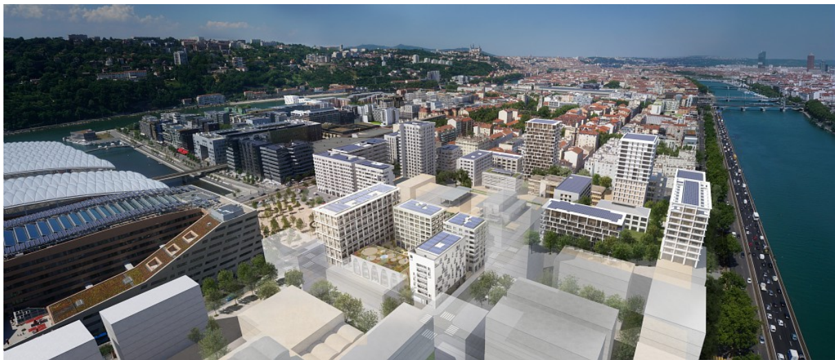
Le quartier du Marché - perspective - 2017

Dans le cadre de la conception des îlots A1-A2 Nord et B2, les architectes travaillent à la réversibilité des futurs bâtiments, situés à proximité de l'autoroute A7. Aujourd'hui programmés en tertiaire, ils pourront demain, lorsque cet axe sera requalifié en boulevard urbain, être transformés en logements. Sans engager d'importants travaux de façade ou de structure, la vocation de ces immeubles pourra ainsi évoluer rapidement pour mieux répondre aux attentes des occupants.