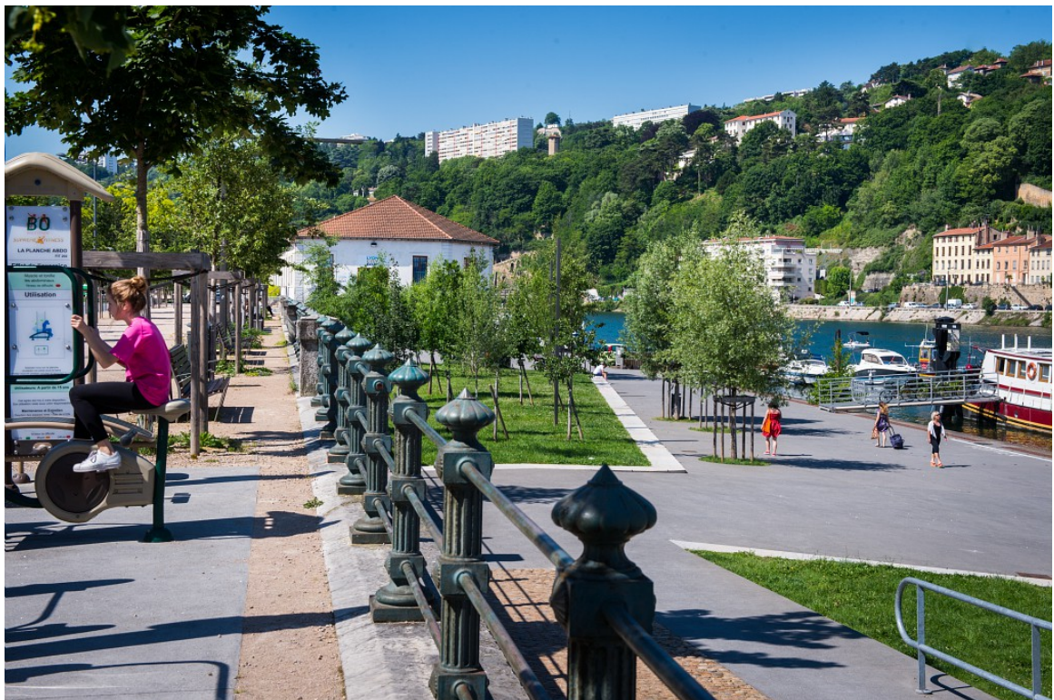
Les Rives de Saône - printemps 2018

La Confluence bénéficie de 5 km de berges, et de grandes vues dégagées. Le réaménagement des rives de Saône offre la possibilité aux riverains et usagers de déambuler sur les quais en toute sérénité, d'investir un espace adapté aux usages des différentes catégories de population avec notamment de tout nouveaux équipements sportifs en libre accès. Ce cheminement s'inscrit dans les 15 km de rives piétonnes accessibles aux habitants de la Métropole.