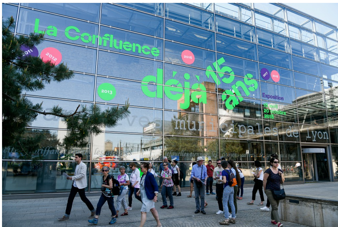
Exposition La Confluence 15 ans déjà - 2018