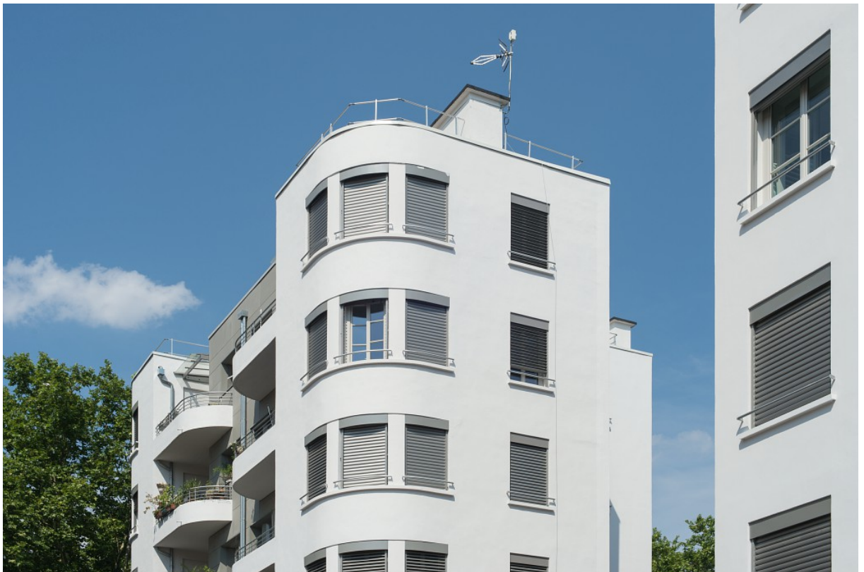
La cité Perrache éco-rénovée

Les habitations à bon marché (HBM) ont fleuri entre les deux guerres mondiales. Face au Marché Gare, les logements sociaux de la Cité Perrache au cœur du quartier Sainte-Blandine ont été créés pour accueillir les foyers aux revenus modestes. Gérés par Grand Lyon Habitat, les logements (275 avant rénovation et 257 après) font l'objet d'une éco rénovation comprenant notamment l'isolation des façades, la fermeture des loggias, l'installation d'un chauffage collectif avec raccordement urbain et suivi de la consommation d'énergie des bâtiments.