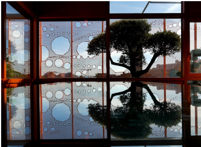
Inside le Cube Orange - 2018

Le Cube Orange : réalisé par Jakob + MacFarlane, cet immeuble est une réinterprétation du profil en arche des Salins du Midi sur lequel il vient s'accoler, une manière originale de créer, à chaque niveau, des atriums patios, véritables puits de lumière.