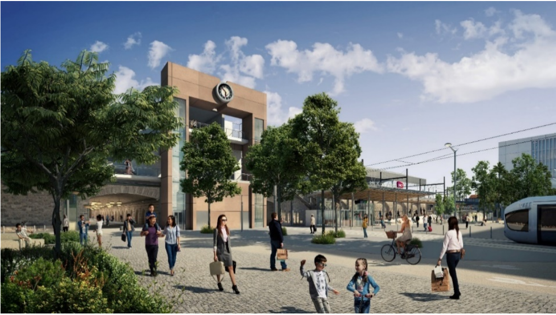
La voûte ouest vue depuis le cours Charlemagne et les réaménagements des accès à la gare SNCF