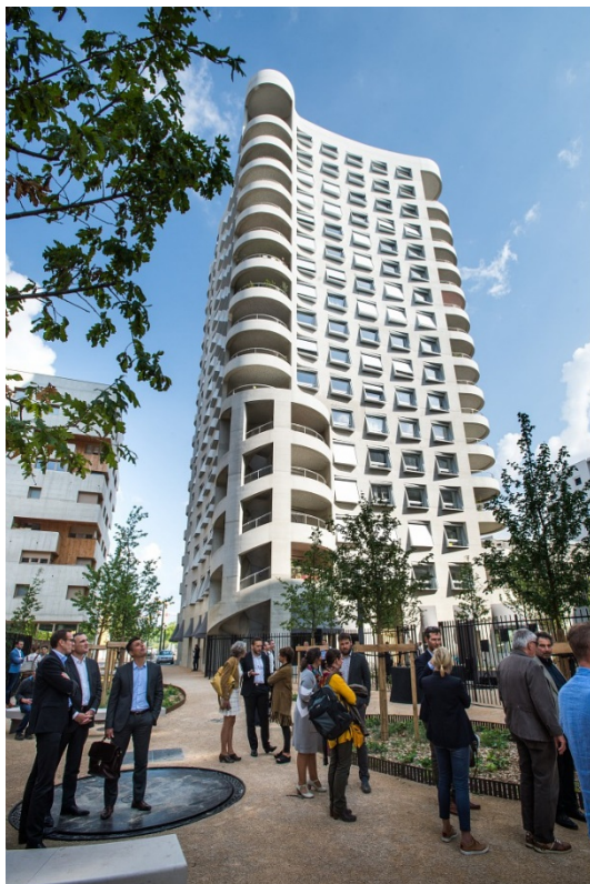
Inauguration d'Ynfluences Square - 2018