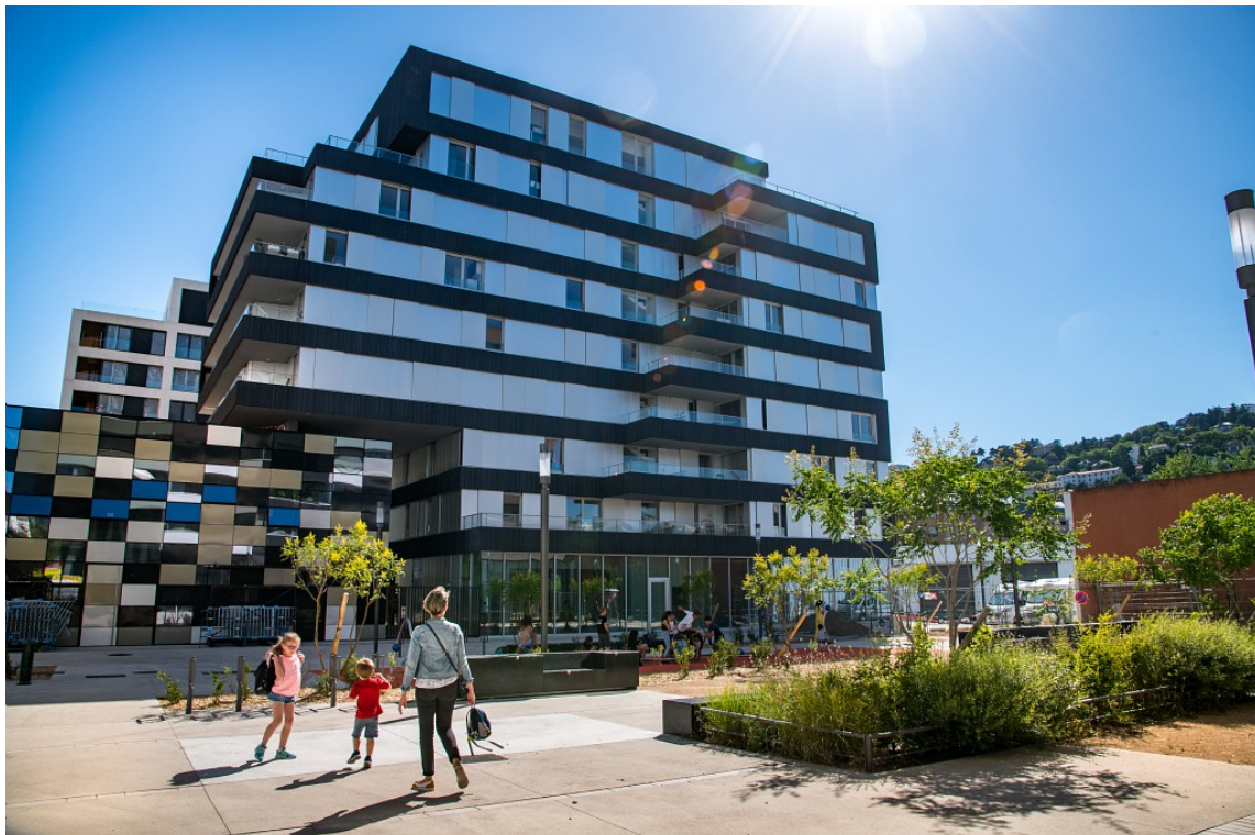
Place Renée Dufour - juin 2018

La mixité sociale à La Confluence est un choix volontariste affirmé dès la conception du projet qui s'appuie sur la volonté politique de la Métropole de Lyon d'avoir une proportion globale de logements sociaux (locatif et en accession) de 23%. Pour chacun des lots à construire, les promoteurs sont invités à respecter, en fonction des clés de répartition attribuées par l'aménageur, une proportion de logements sociaux, intermédiaires et libres.