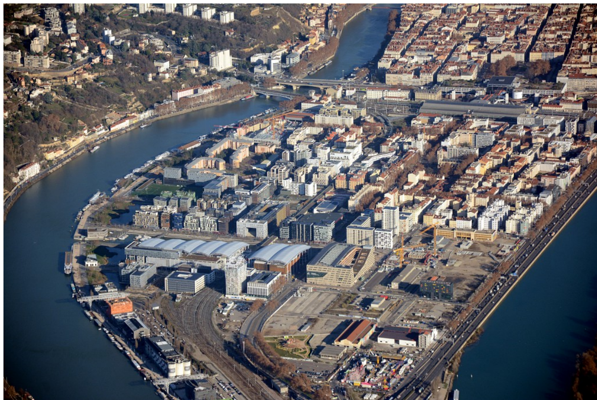
La Confluence vue du ciel - 2019

Des équipements de loisirs urbains – salle de sport, mur d'escalade, un cinéma UGC Ciné Cité de 14 salles et 3 480 fauteuils