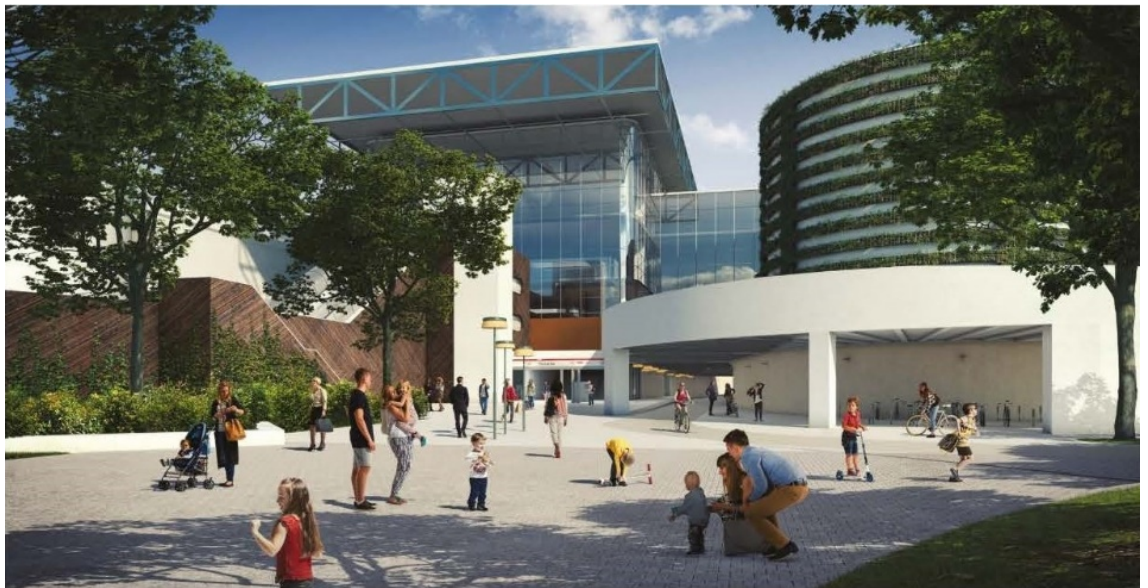
La voûte ouest vue depuis la place Carnot