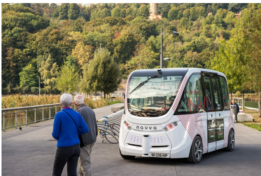
NAVLY, navette électrique autonome - octobre 2016

Depuis septembre 2016, Lyon Confluence expérimente NAVLY, une navette de transport public 100% électrique, autonome (sans conducteur) sur un parcours de 1,3 Km. Cette expérimentation vise à tester la fiabilité du système, l'attrait du public pour un véhicule sans conducteur, et à étudier le potentiel de cette nouvelle technologie dans la mobilité urbaine. Fin octobre 2017, Navly avait parcouru plus de 14 000 km sans incident majeur et transporté 22 000 passagers. Cette initiative a suscité l'intérêt au plan national et international : plus de 70 délégations sont venues à Lyon pour découvrir Navly, son fonctionnement et son intégration en lien avec les transports en commun lyonnais.