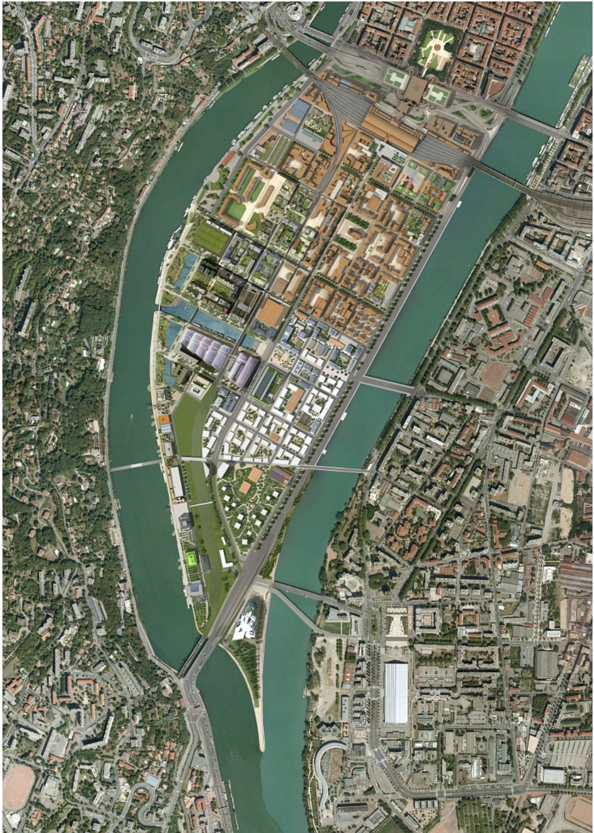
La Confluence dans son environnement - plan masse - septembre 2018