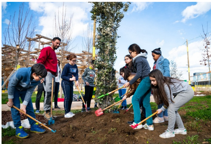
par les élèves de l'écoles Germaines Tillon

Station Mue : plantations d'arbres - mars 2019