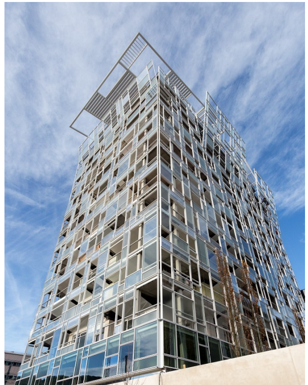
Ycone - automne 2018

La tour Ycone : conçue par Jean Nouvel comme une œuvre d'art, Ycone est l'illustration de sa vision d'une architecture vivante, humaine et surprenante. Cet immeuble de belle hauteur de 14 étages sera tout en «symphonie de blancs, d'écailles et d'écrans translucides et clairs» avec un toit terrasse, et enveloppé d'une ceinture végétale.