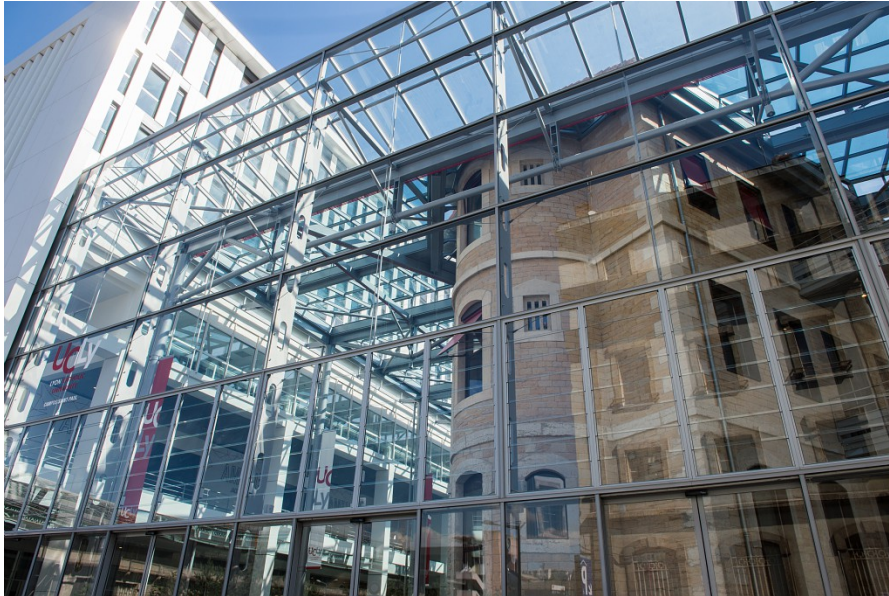
L'Université Catholique de Lyon (UCLY) – septembre 2018

En accueillant l'Université Catholique de Lyon (UCLy) ainsi qu'un programme mixte de logements (ensemble d'habitat intergénérationnel) et de bureaux, la reconversion des anciennes prisons Saint-Joseph (1827-1831) et Saint-Paul (1860-1865) est un bel exemple de réhabilitation de l'existant, en cohérence avec les exigences des réalisations du quartier neuf. Ainsi, sur un jeu d'ouverture et de lien, c'est 40% du bâti existant qui a été préservé.