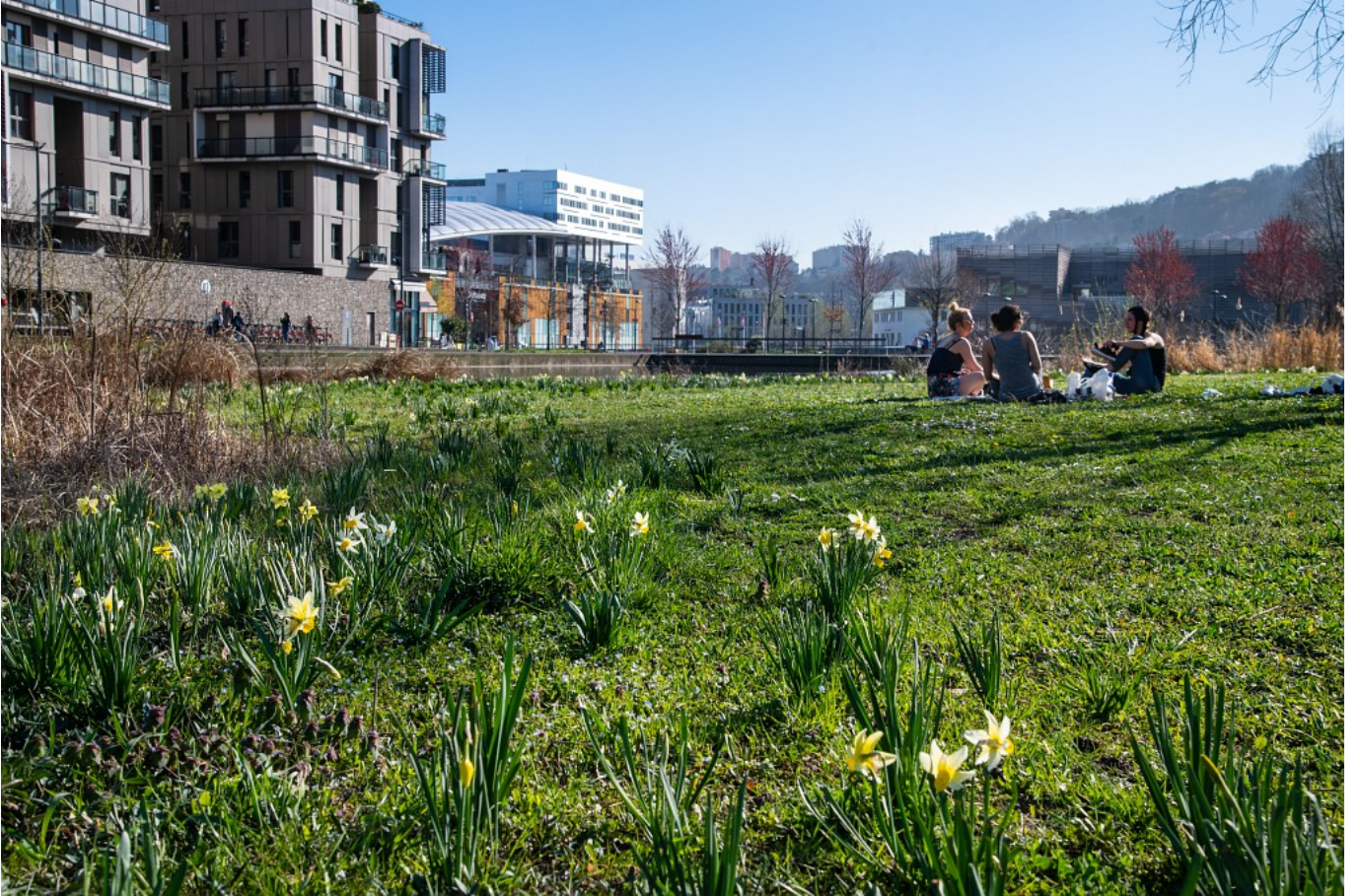
Le jardin Ouagadougou - printemps 2019