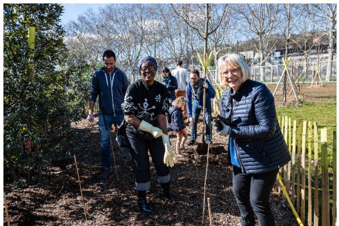
par les habitants du quartier