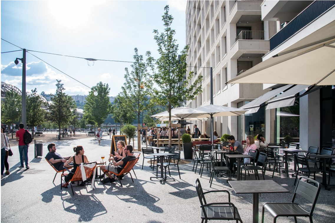
Esplanade François Mitterrand - juin 2018