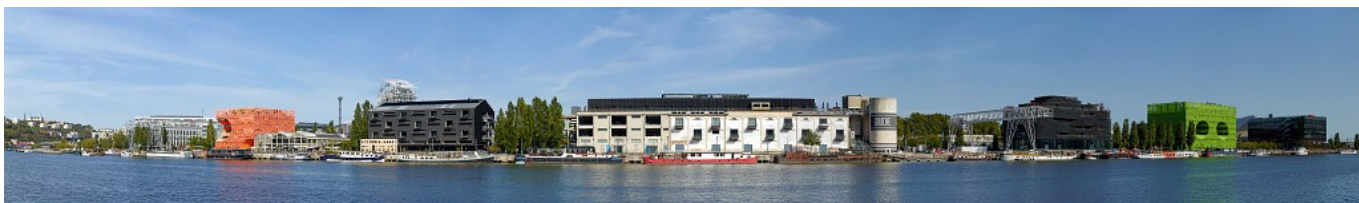
Vue panoramique des Docks et ses bâtiments -septembre 2018

Le Dark Point : tout près, Odile Decq s'est aussi inspirée de la vie des docks pour constituer le bâtiment. Deux parallélépipèdes désaxés se superposent. Le volume supérieur enjambe le quai par un grand porte-à-faux.