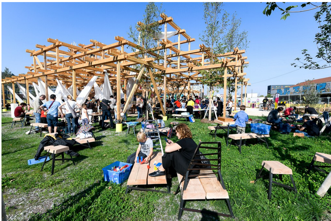
Station Mue - festival Kiosk - octobre 2018

Le parc de de la Station Mue est conçu comme un entomoparc pour abriter les insectes, premiers acteurs de la renaturation d'un site. Ils jouent un rôle primordial dans le développement et la préservation des fragiles écosystèmes, ils sont à la base de la chaîne alimentaire et permettent ensuite d'attirer d'autres espèces.