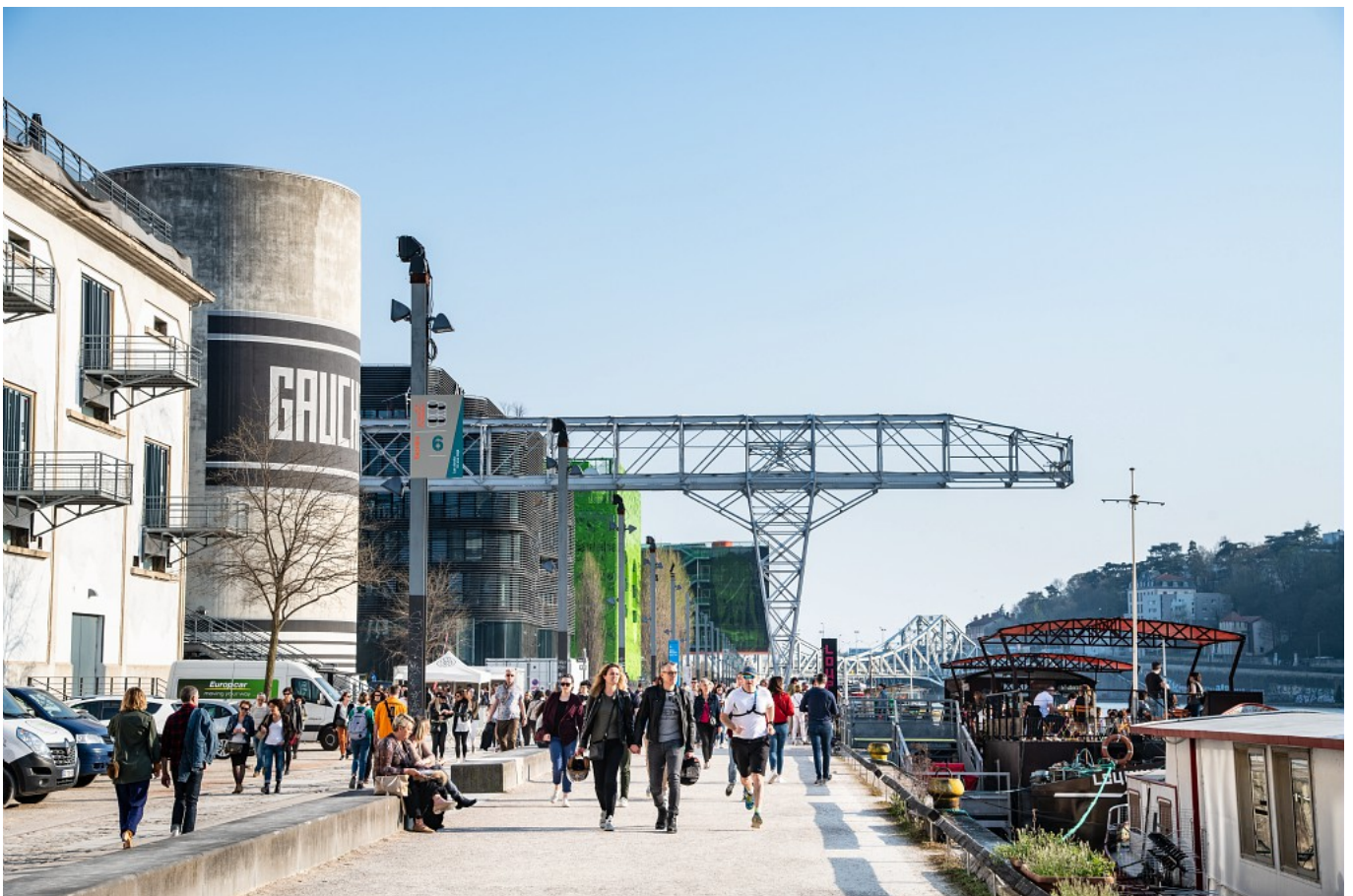
Les Docks - Exposition Les Docks, 10 ans déjà - printemps 2019